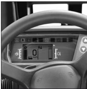
Panel de información LED/LCD de primera categoría