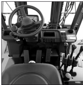
Compartimento espacioso para el operario