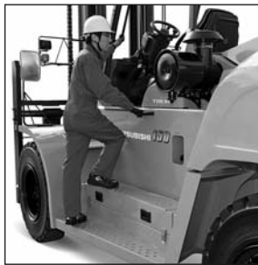
Peldaño y agarradera para fácil acceso